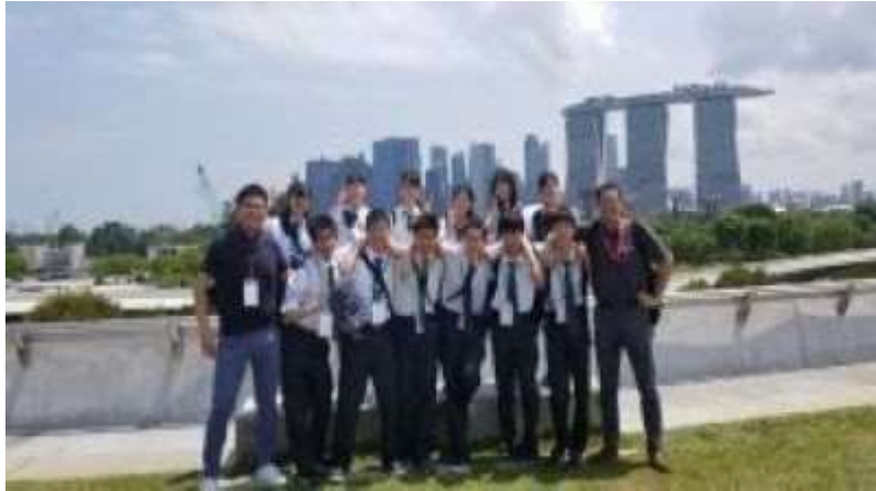
Marina Barrage 見学の様子