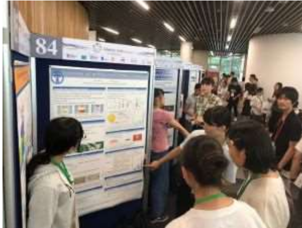
フリーポスターセッションの様子